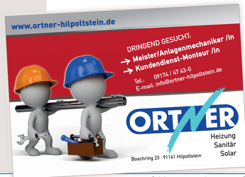
Großplakat zur Verwendung im Straßenverkehr

Die Firma Ortner Heizung Sanitär Solar wollte raus aus der bisher gewohnten Bildsprache! Auch hier ist ein Wiedererkennungswert für die Verwendung bei den unterschiedlichen Medien wichtig!