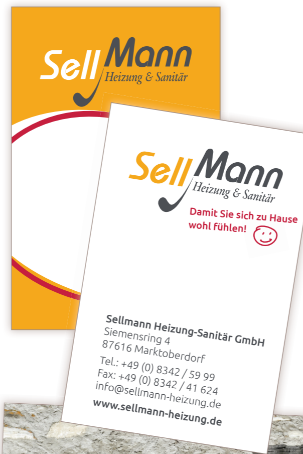
Visitenkarten im neuen CI