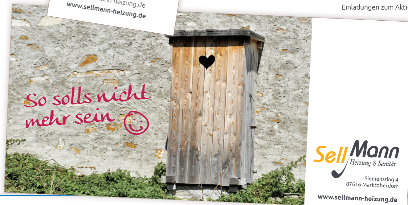
Einladungen zum Aktionstag

Für die Sellmann Heizung-Sanitär GmbH entstanden unter anderem Anzeigen mit Hingucker-Garantie und Einladungen zum Aktionstag, die aus dem Rahmen fallen. Damit alles ein einheitliches Bild ergibt, passen auch die Visitenkarten zur neuen Optik des Erscheinungsbildes.